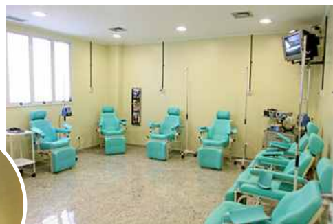
Sala de Quimioterapia do Centro Oncológico do Hospital Vida's Alta Complexidade